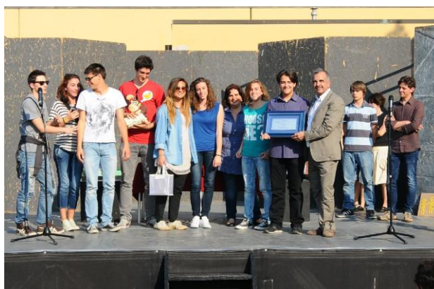
I vincitori dell'edizione 2012: Liceo "Giordano Bruno" di Budrio (BO)

Per partecipare è sufficiente, dopo aver letto il bando di concorso, compilare e firmare il modulo di iscrizione e la scheda di partecipazione allegati e inviarli con le modalità e nei tempi indicati.