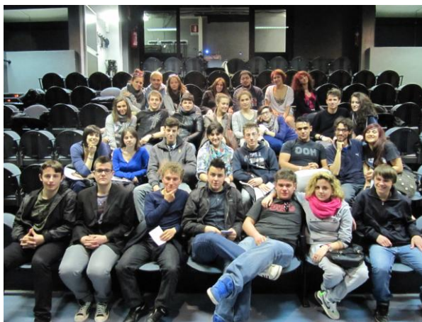
Festival 2012: la Giuria di Ragazzi

Nel 1995 , diciotto anni fa, nasceva la piccola rassegna dei saggi di fine anno dei laboratori del Teatro dell'Argine nelle scuole; piccola rassegna che negli anni crebbe a tal punto da convincerci, nel 2001 , a dar vita a un vero e proprio Festival, aperto a tutti. Dal 2001 sono passati tredici anni .